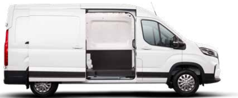
Dimensions modèle L3H2